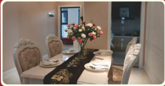
(雍水岸样板房实拍图)

现场每天的工作还有很多,不能一一列举,但我们景茂全体员工心往一处想,劲往一处使,日以继夜,积极做好现场施工进度,将确保工程的顺利开展。