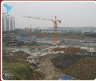
(操作中,我们干劲十足)